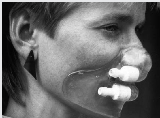
Figura 2. Esempio di maschera per la ventilazione non invasiva

Con l'aggravarsi dell'insufficienza respiratoria, possono svilupparsi i sintomi di ipoventilazione cronica notturna riassunti nella tabella 3. Questi sintomi possono deteriorare gravemente la qualità di vita dei pazienti. La ventilazione intermittente non invasiva attraverso maschera (NIV, figura 2) rappresenta un modo efficace e conveniente di alleviare tali sintomi (20,49) , che può persino prolungare considerevolmente la vita media dei pazienti (1) . Come sottolineato in precedenza, questa metodica dovrebbe essere discussa con il paziente e la sua famiglia all'insorgere dei sintomi di ipoventilazione cronica. Essi dovrebbero essere informati sulla natura temporanea di questa soluzione, che è volta primariamente a migliorare la qualità della vita piuttosto che a prolungarla (a differenza della tracheotomia). Il problema relativo alla ventilazione meccanica di solito non è legato al costo o alle difficoltà tecniche, bensì